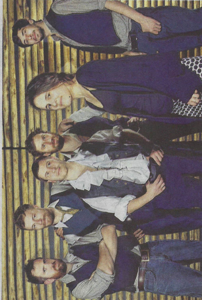
Six musiciens composent le groupe

Né d'envies et d'un besoin de partage, grandissant dans l'énergie et la danse, « Le Fil d'Ariane » transmet les valeurs qui l'ont créé. Ces six musiciens vous raviront d'envolées virtuoses et d'éclats instrumentaux sur un fil tendu entre musique traditionnelle balkanique et attitude rock'n'roll. Voix, violon, mandoline, violoncelle, accordéon, guitare, flûte, percussions (Davul)